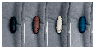
POSIBILIDAD DE ELEJIR EL COLOR DEL ALAMAR NEGRO • CHOCOLATE • NIEVE • AZUL ROYAL