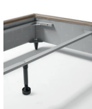
BARRA SOPORTE SOMIERES INDIVIDUALES